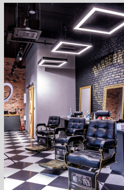
Barber King, Kraków KING barber, Cracow