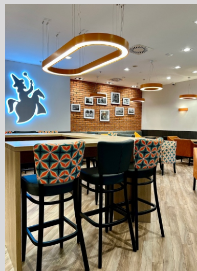
Lajkonik - cukiernia kawiarnia Kraków ul. Bratysławska

Tolerancja strumienia świetlnego i mocy +/- 10% Producent zastrzega sobie możliwość zmian konstrukcyjnych oprawy. Istnieje możliwość modyfikacji produktu na życzenie Klienta. Informacje zawarte na karcie katalogowej nie stanowią oferty handlowej ani elementu umowy. Więcej na temat rodziny produktów, znajduje się na stronie: www.lako.pl