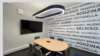
Biuro ZOTT - Flatiron - Opole