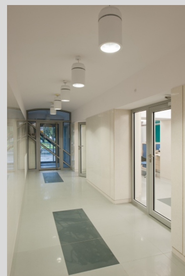
Bank Spółdzielczy, Skawina 'Spółdzielczy' BANK Skawina

Tolerancja strumienia świetlnego i mocy +/- 10% Producent zastrzega sobie możliwość zmian konstrukcyjnych oprawy. Istnieje możliwość modyfikacji produktu na życzenie Klienta. Informacje zawarte na karcie katalogowej nie stanowią oferty handlowej ani elementu umowy. Więcej na temat rodziny produktów, znajduje się na stronie: www.lako.pl