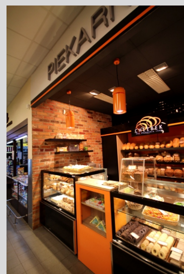
Piekarnia CHLEBEK, Lubsko CHLEBEK bakery, Lubsko