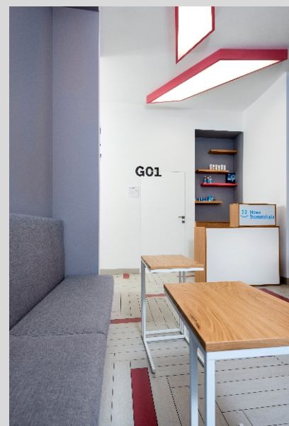
32 Nowa Stomatologia, Kraków 32 Nowa Stomatologia dental clinic, Cracow