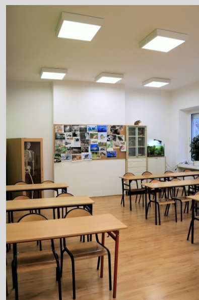
Liceum ogólnokształcące nr 2 im. Pawła Jasionicy, Warszawa High school, Warsaw