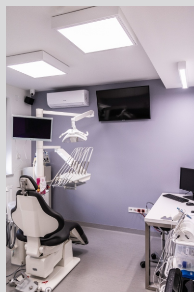
Klinika stomatologiczna DENTRUM, Katowice DENTRUM dental clinic, Katowice