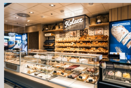
Piekarnia - cukiernia Kołacz KOŁACZ bakery

Tolerancja strumienia świetlnego i mocy +/- 10% Producent zastrzega sobie możliwość zmian konstrukcyjnych oprawy. Istnieje możliwość modyfikacji produktu na życzenie Klienta. Informacje zawarte na karcie katalogowej nie stanowią oferty handlowej ani elementu umowy. Więcej na temat rodziny produktów, znajduje się na stronie: www.lako.pl